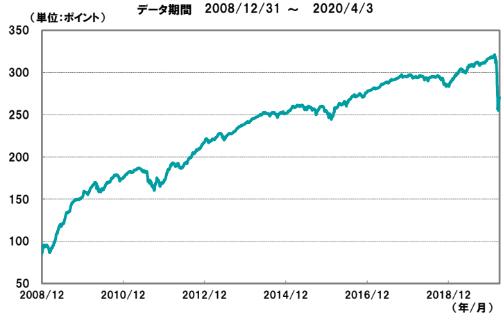
【図1】欧州ハイ・イールド債券指数の推移