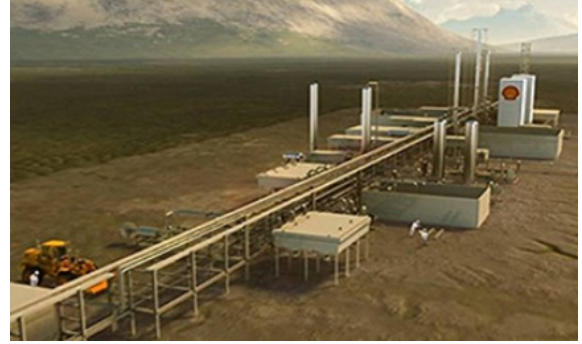
写真：移設可能な液化ユニット

プロジェクトの総額は約20億米ドルで、2017年2月に株式の49%を米国EIGグローバル・エナジー・パートナーズに譲渡し、共同で事業を進めています。