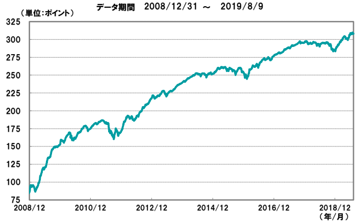
【図1】欧州ハイ・イールド債券指数の推移