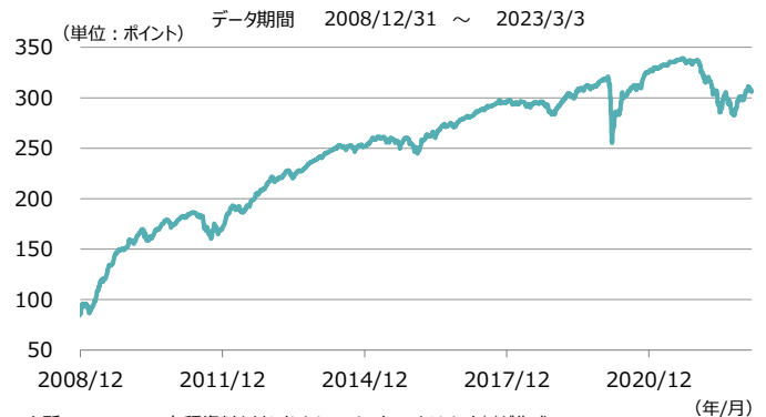
【図1】 欧州ハイ・イールド債券指数の推移